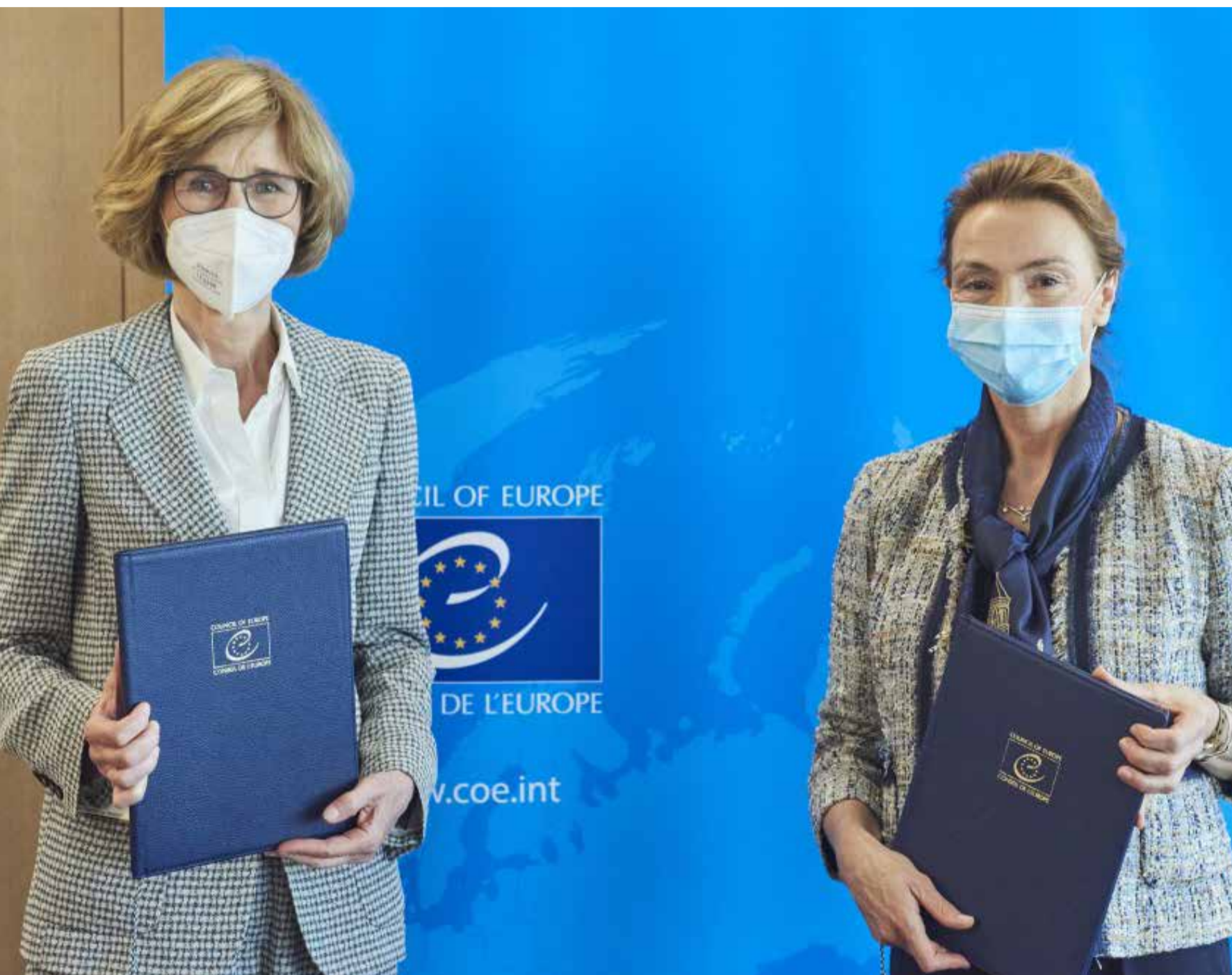
Firma del Convenio de Colaboración entre el Consejo de Europa y CCBE